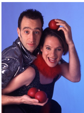
Duo Full House